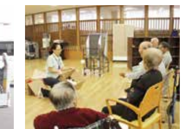
●レクリエーション