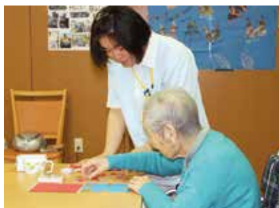
●レクリエーション