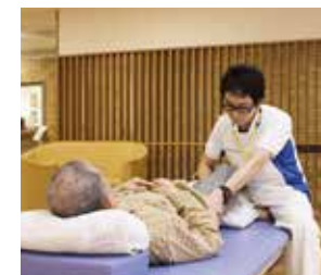
●リハビリテーション