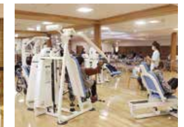
●パワーリハビリテーション