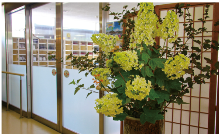
エントランス(みのり棟)

介護老人保健法により施設介護サービスを提供する介護老人福祉施設です。 建物は「みのり棟」と「わかば棟」に分かれ、身体上または精神上の障害によりご自宅での生活が困難な方を対象に、可能な限り自立した日常生活が営めるように支援いたします。 食事・入浴・排泄などの生活全般について、ケアプランを作成し利用者さん一人ひとりの状態に合わせた介護サービスを提供します。