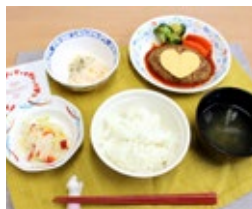
(写真はバレンタイン行事食)

毎日、2種類のメニューを提供し、 好きなお食事をお選びいただけます。 (1食 390円)